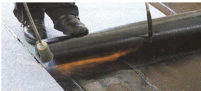
Natavování s navijčem rolí rozbalovačem rolí